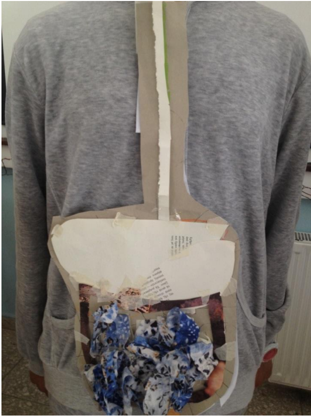
χαρτί (οισοφάγος, στομάχι, παχύ έντερο), ύφασμα (λεπτό έντερο)